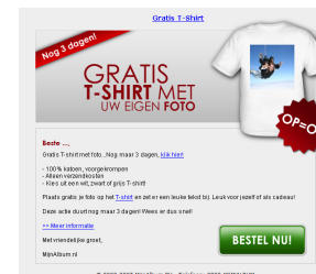
4. Standalone mail

Let op! Targeting is mogelijk op gebruikers die foto's plaatsen in een bepaalde categorie (o.a. Baby's, vakantie, voetbal etc.), afname minimaal 10.000 adressen.