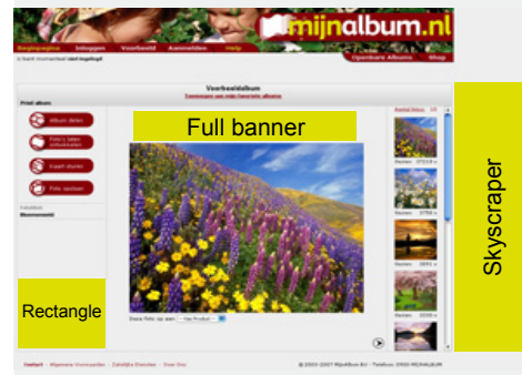
1. Rectangle, full banner en skyscraper

Onder of boven elke foto kan een tekstlink worden geplaatst, deze verwijst naar uw website.