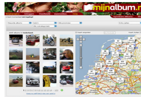
3. Doelgericht adverteren op land, provincie en plaats

Adverteer doelgericht op mannen of vrouwen.